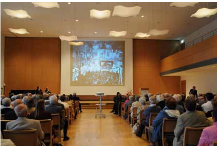
8. Ordentliche Mitgliederversammlung, 25.9.2010.

Bitte beachten Sie, dass eine gleichzeitige Teilnahme am Gottesdienst und an der Führung auf dem Alten Katholischen Friedhof nicht möglich ist.