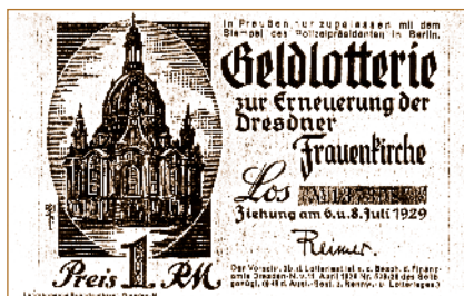
Los der Frauenkirchen-Lotterie von 1929.

den. Im März 1993 wurde die Fördergesellschaft dann Veranstalter der jährlich in mehreren Serien durchgeführten Losbriefgeldlotterien zugunsten des Wiederaufbaus der Frauenkirche. Vor der Veranstaltung der Lotterien musste immer eine Erlaubnis der Genehmigungsbehörde – in Sachsen damals das Regierungspräsidium Chemnitz – beschafft werden. Bis zum Abschluss des Wiederaufbaus konnten so mehr als 685.000 EURO für den Wiederaufbau erwirtschaftet werden. Heute dienen die Lotterien der Unterstützung der Frauenkirche und der Tätigkeit der Fördergesellschaft. Ab 2011 beträgt der Lospreis 50 Cent. Wir werden dabei von der nun zuständigen Landesdirektion Leipzig als Genehmigungsbehörde und der für Sondernutzungen zuständigen Abteilung im Straßen- und Tiefbauamt der Landeshauptstadt Dresden begleitet. Die Geschäftsführung sowie die Mitarbeiterinnen und Mitarbeiter der Lotterie-Geschäftsstelle Miene sind engagierte Partner, denen für Ihre Tätigkeit und das jährlich erzielte Ergebnis zu danken ist. So helfen auch die Frauenkirchen-Lotterien weiter mit, satzungsgemäße Aufgaben der Fördergesellschaft zu unterstützen. HJJ