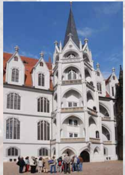
Oben: Chiesa Luterana Florenz, Mitte: Wendelstein der Albrechtsburg, unten: Gruppe aus Florenz auf dem Hof der Albrechtsburg, Meißen, 28.5.2011.