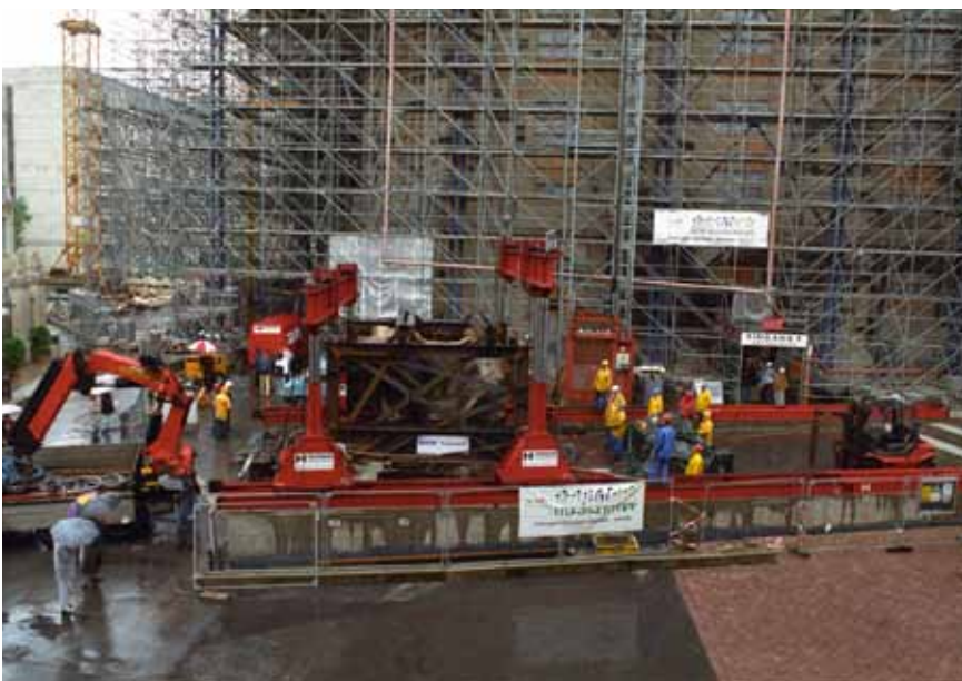
Links: Präsentationsstand der Stadtparkasse Dresden für die Frauenkirchen-Uhren, 27.5.1993, rechts: Vor der Drehung des „Schmetterlings“, August 2001.