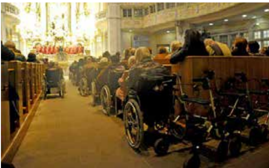
Sonderkonzert des Philharmonischen Kinderchores Dresden in der Frauenkirche, 15.11.2017.