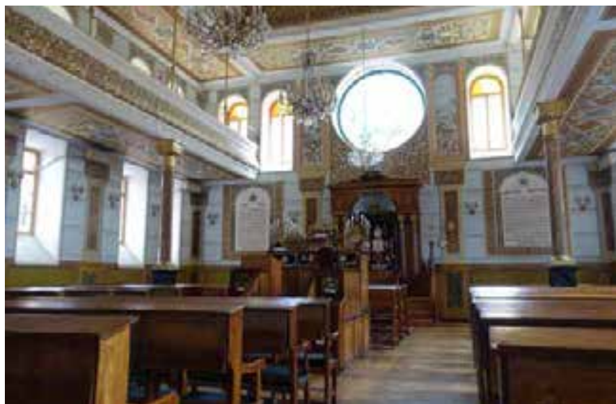
Synagoge Tbilissi, 3.6.2018.

Unvergesslich bleibt der Blick auf den schneebedeckten Gipfel des Kasbek, mit 5.047 m der dritthöchste Berg des Kaukasus. Der Sage nach hatte Zeus Prometheus dort festgeschmiedet. Ein Adler riss ihm täglich die immer wieder nachwachsende Leber heraus. Der Rückweg führte uns wieder auf der Georgischen Heerstraße an Rinder- und Schafherden vorbei, die die Straße oft ganz selbstverständlich vereinnahmten, dann aber bereitwillig den Fahrzeugen ausweichen.