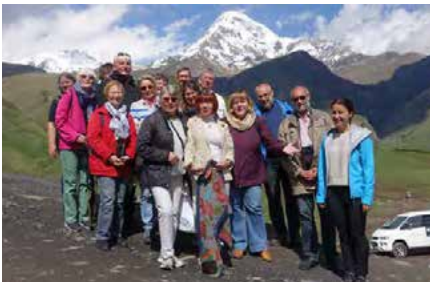
Oben: Gergettier Dreifaltigkeitskirche, unten: Exkursionsteilnehmer im Gebirge, 5.6.2018

Tags darauf führte uns der Weg durch eine imposante Landschaft zum Berg Aragats, zum Psalmenkloster Saghmosawank, in dessen Skriptorium zahlreiche Handschriften entstanden waren, zum Kloster St. Johannes der Täufer sowie zu der auf einem Bergplateau gelegenen Burgruine und Kirche Amberd aus dem 9. Jahrhundert. Zurück in Jerewan erwartete uns das Mittagessen in einem Blumengarten. Am Nachmittag besuchten wir die Gedenkstätte Zizernakaberd, die an den Völkermord an den Armeniern im Jahr 1915 erinnert. Sehr bewegt