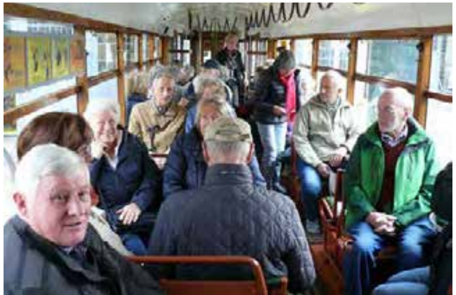
Mitglieder des Osnabrücker Freundeskreises Frauenkirche Dresden (OS-FK FK-DD) in der historischen Dresdner Straßenbahn „Großer Hecht“, 23.9.2017.