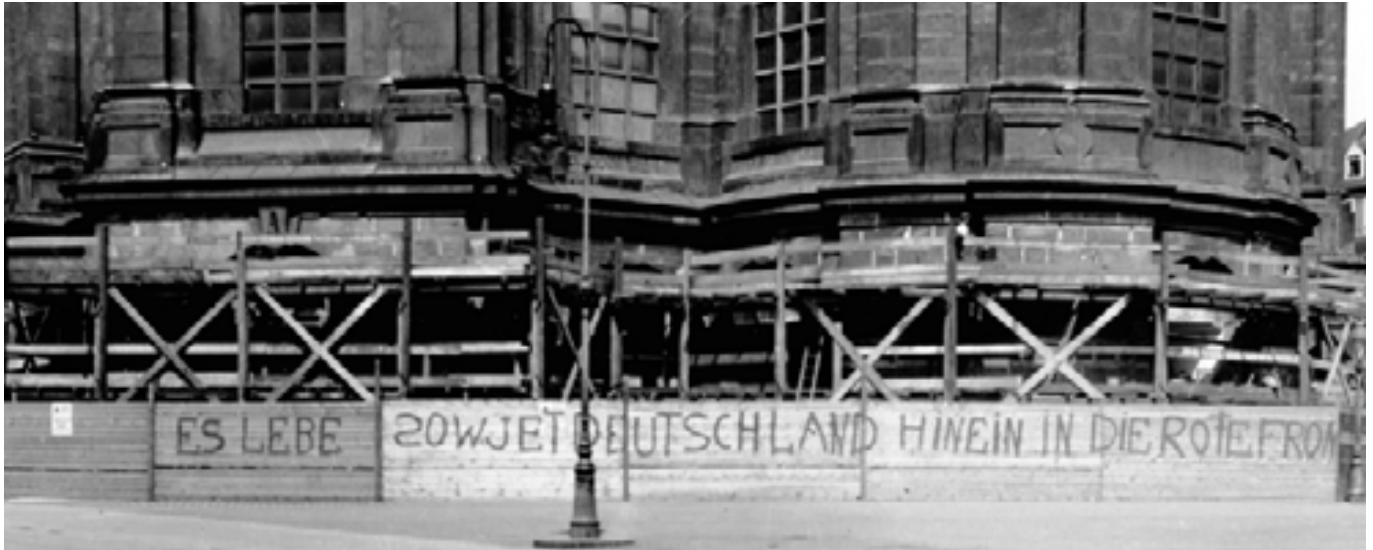
Gerüst und Bauzaun an der Südseite der Frauenkirche, 1931

Wie das Foto zeigt, musste die Frauenkirche auch damals schon als Kulisse für politische Forderungen erhalten. AS