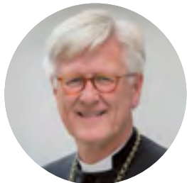
DR. HEINRICH BEDFORD-STROHM bayerischer Landesbischof und EKD-Ratsvorsitzender

HEINRICH BEDFORD-STROHM , bayerischer Landesbischof und EKD-Ratsvorsitzender, gerade zusammen mit Kardinal Reinhard Marx mit dem Augsburger Friedenspreis ausgezeichnet, zeigt in seinem Vortrag zum Thema „Öffentliche Theologie und interreligiöser Dialog“ eine Perspektive auf, in der gerade ein entschiedenes Christusbekenntnis als Quelle von Toleranz und friedlichem Miteinander der Religionen deutlich wird.