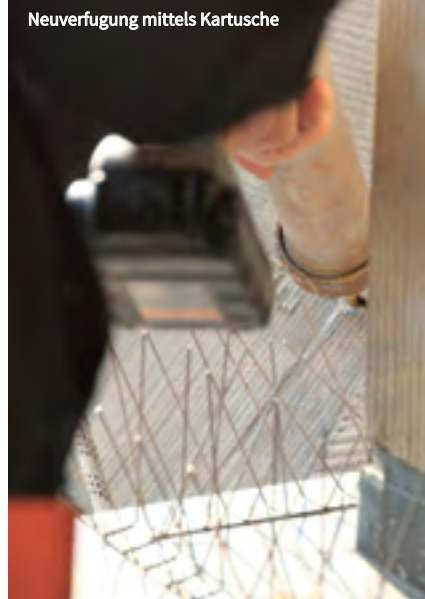
Neuverfugung mittels Kartusche