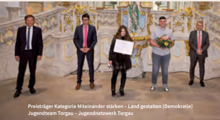
Preisträger Kategorie Miteinander stärken – Land gestalten (Demokratie) Jugendteam Torgau – Jugendnetzwerk Torgau