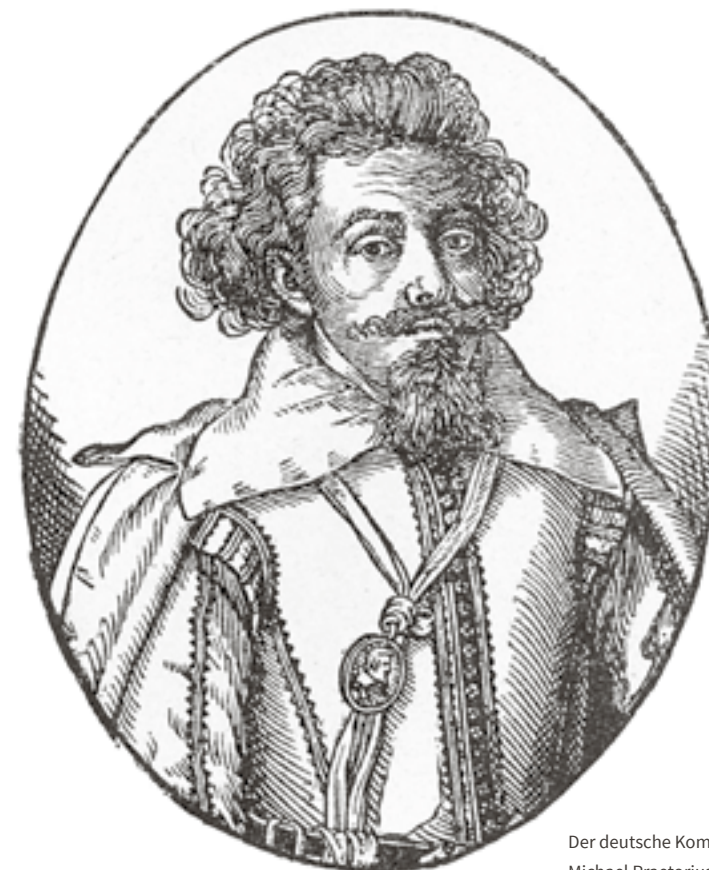
Der deutsche Komponist Michael Praetorius (1571-1621)

Den Abstand zu dem Publikum haben die Ensembles nur auf dem ersten Blick: Immer möge die Emotionalität der Kirchenmusik die Nähe der Zuhörer finden und das Herz derer durch das Musizieren der Instrumentalisten, Solisten und Choristen erreichen! Dazu lädt der Sonntagnachmittag in die Frauenkirche ein, dann, wenn in Abständen die Geistliche Sonntagsmusik im Kalender steht...